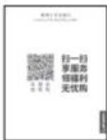
Manual de utilizare